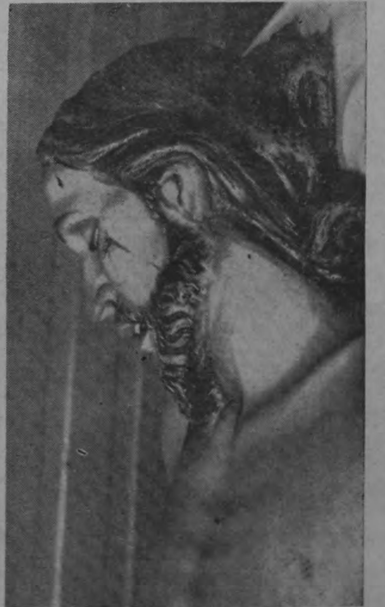
PERFIL DEL CRISTO EN EL SEPULCRO

Conferencias como ésta han sido ya impartidas por el Departamento de Relaciones Públicas en el Ministerio de Obras Públicas, las cuales despertaron sumo interés entre los servidores del mismo el futuro serán impartidas ante el personal de otros ministerios y de instituciones autónomas.