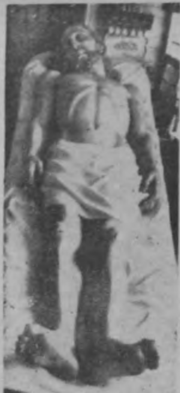
Cristo yacente, de Olger Villegas

Ayer tuvo un redactor de este periódico oportunidad de admirar la obra de un artista costarricense. En forma eventual nos enteramos de una obra realizada por un joven escultor que había sido encomendada por altos dignatarios de la Iglesia que fueron a contemplarla en el humilde taller de trabajo de este compatriota.