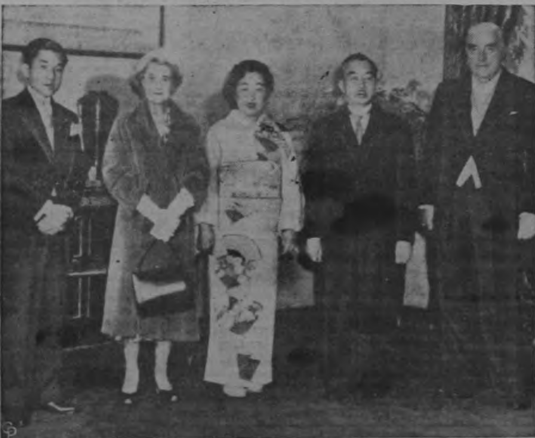
El Primer Ministro de Australia Robert G. Menzies (derecha) tuvo una audiencia con el Emperador Hirohito y la Emperatriz Nagako del Japón durante una visita oficial a Tokio. También estuvo presente el Príncipe heredero Akihito (izquierda) y la esposa de Menzies. Tras la reunión hubo un almuerzo informal con la familia imperial. Menzies también visitó los principales centros industriales del Japón, en Kyoto y Osaka.