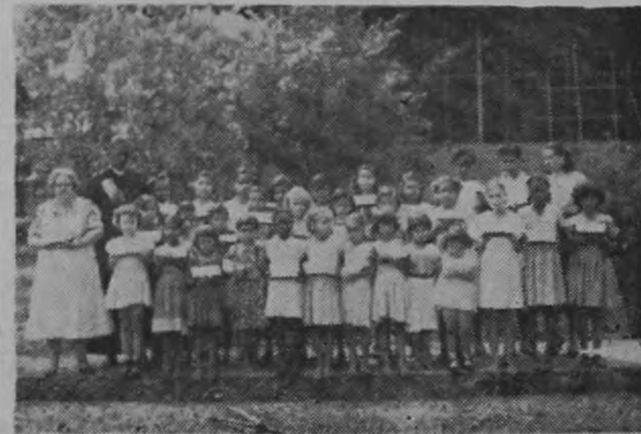
NINOS DE LA ESCUELA JUSTO A. FACIO DE SIQUIRRES, posan luego de haber recibido los regalos enviados por los niños de la Cruz Roja Infantil de los Estados Unidos. El grupo no está completo. Recibieron obsequios 195 niños de esa Escuela.